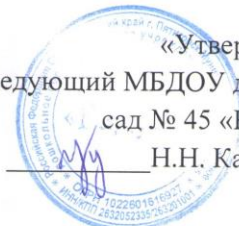
График проведения аттестации педагогических работников на соответствие занимаемой должности в 2020-2021 учебном году